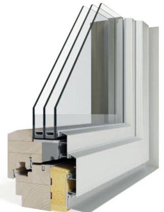
Termoscudo, Easy Line