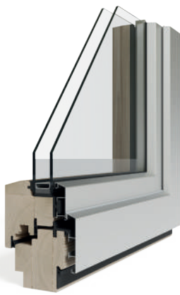
Sistemi 5000 S