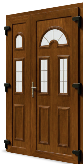
Plastikë (PVC) Ngjyra: E artë